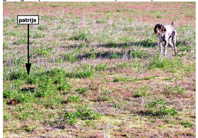
HOND STAAT VOOR OP PATRIJS

Dan zijn er ook nog honden die meer aanwijzen dan voorstaan. Bij deze honden ontbreekt het echte vastmaken. Ze verwaaien, trekken aan en stoppen dan. Deze honden weten vaak wel globaal waar het wild zich bevindt maar niet exact. Ze naderen dan ook niet dicht genoeg om het wild echt vast te maken. Bij dit soort gedrag loopt wild vaak onder de neus van de hond vandaan. Gewoon omdat de hond niet doortastend genoeg is. Dit kan gebrek aan passie zijn, onzekerheid over hoe met wild om te gaan, of aangeleerd gedrag. Dit probleem wordt verderop nader besproken.