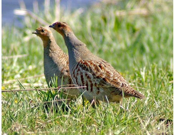
2 Koppel patrijzen

steppebewoners, maar de soort heeft zich erg goed aangepast aan het leven in kleinschalig agrarisch landschap. In Nederland komt de soort verspreid voor maar is vooral te vinden in het oosten en het zuiden en in Zeeland. Patrijzen gedijen goed in een terrein waar de akkers worden afgewisseld met bloemrijke ruige dijken, slootranden, wegbermen en houtwallepjes.