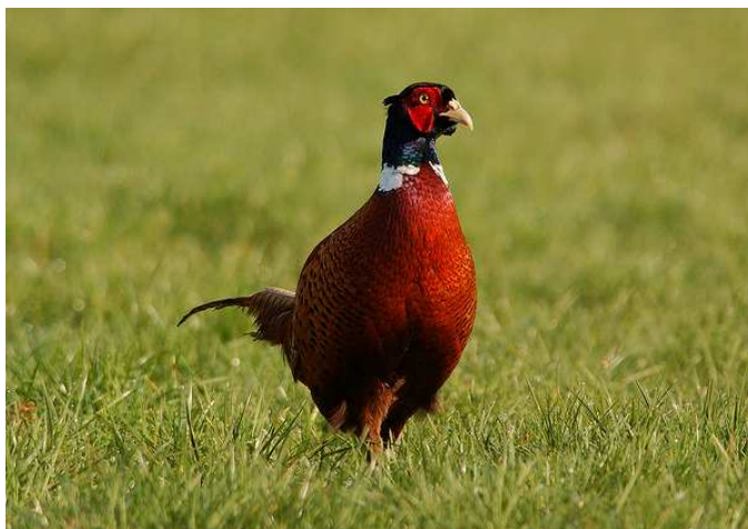
5 Fazant (haan)

Zoals gezegd zorgt het hennetje van de fazanten voor de kids en pa gaat weer zijn eigen weg. In het voorjaar kun je bij een fazanten haan dus zeer zeker ook hennen verwachten, in het najaar is dat niet zo vanzelfsprekend. In augustus en september zorgt de hen voor haar kroost.