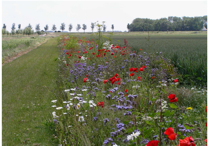
3 Ideale biotoop patrijs (en fazant)

Het is een vogel van het open landschap. In dichte dekking zal je 'm niet aantreffen. In tegenstelling tot de fazant die ook zeer goed gedijt in de net geschetste biotoop maar van oorsprong een moerasvogel is. Fazant vindt je zo goed als overal, behalve in echt voedselarme gebieden zoals de Veluwe. Akkers, bosschages, riet, ruigtes zijn prima voor fazanten. In de Randstad zit het er vol mee. Fazanten en patrijzen kun je regelmatig aantreffen op braakliggende terreinen. Het gebeurt wel dat op een braakliggend terrein vele patrijzen gehuisvest zijn, dat er vervolgens allerlei gebouwen geplaatst worden maar er nog enkele kleine hoekjes braak blijven liggen. Dan zijn de patrijzen (en fazanten) er waarschijnlijk ook nog gewoon. Het zijn cultuurvolgers. Het enige waar ze niet goed mee om kunnen gaan is de schaalvergroting van de landbouw. Eindeloze lappen maïs, tarwe, gras etc. zonder natuurlijke onderbrekingen als sloten, bosschages en overhoekjes zijn funest voor deze vogels.