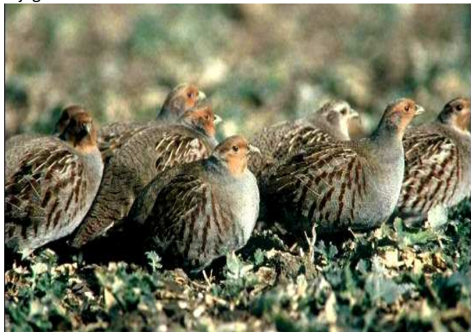
4 Klucht patrijzen (ouders en kids)

wegkomen voor eventuele belagers valt ook niet mee. Nee, ze vertoeven veel liever op de randen. Daar staat nog wel eens wat onkruid (is zaden en insecten), je kunt de dekking uit gaan om in de zon te baden of juist in de slootkant of onder de bieten kruipen op moment dat er gevaar dreigt. Ook houden ze niet van harde wind of regen. Is er een dijkje of een randje in het veld waardoor ze uit de wind kunnen zitten, dan zullen ze dat doen. Het wild kun je dus verwachten aan de luwe kant van de dijk. Dat is voor de hond niet gemakkelijk want onder een dijk is er vaak minder gunstige wind maar dit is wel degelijk een zeer belangrijke plek om mee te nemen in het afjagen van het veld.